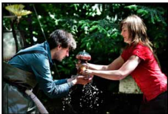
DE LEGENDE VAN WOESTERDAM

"De acteurs maken het moderne sprookje zo geloofwaardig, dat je als volwassen toeschouwer tegen je zin het buurtparkje verlaat, opnieuw de grote boze wereld in....Het doet volkomen vergeten dat we op klaarlichte dag om de hoek van het festivalterrein van Theaterfestival Boulevard in een park in de bosjes zitten. De legende van Woesterdam is een voorstelling waardoor je na afloop opeens blijkt te huppelen." (DE VOLKSKRANT, JOWI SCHMITZ)