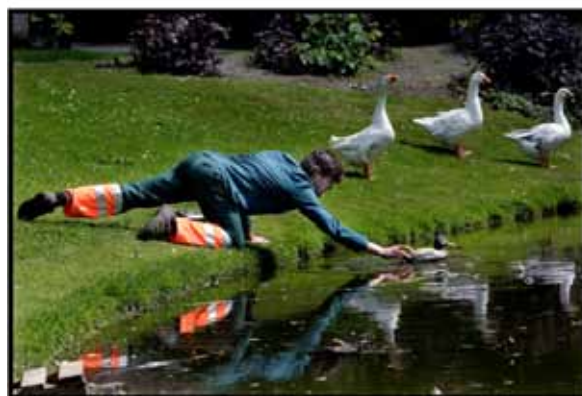
DE LEGENDE VAN WOESTERDAM