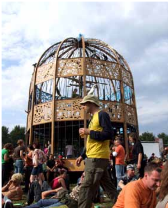
vogelkathedraal op Lowlands