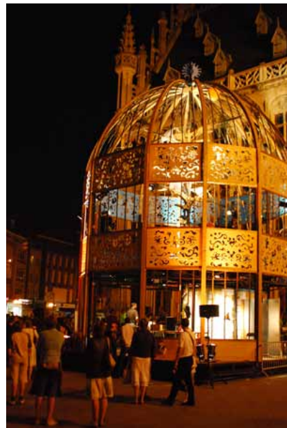
vogelkathedraal op Grote Markt Leuven